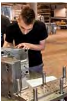
Einweisung an einer Bohrmaschine.

Zudem gehört die Wartung und Reparatur von Werkzeugen und Vorrichtungen zu den Aufgaben.