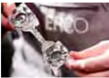
Visuelle Begutachtung während des Spritzgießprozesses bei der Kollimatorfertigung.