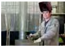
Anfertigung von Ersatzteilen und Baugruppen.

Der Beruf des/der Industriemechanikers/-in ist im heutigen Fertigungsprozess besonders wichtig. Sie bearbeiten Werkstücke oder mechanische Einzelteile und bauen diese zu Produktionsanlagen oder anderen technischen Geräten zusammen.