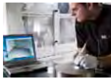
Optische Prüfung der mikrostrukturierten Oberfläche des Spherolit-Spritzgießwerkzeugs.