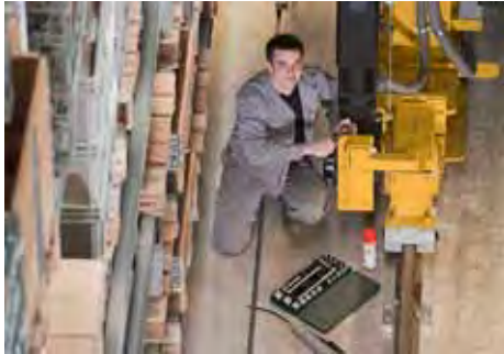
Wartung des Fahrtriebes eines Regalbediengerätes im Hochregallager.