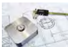
Der Umgang mit Zeichnungsnormen und das Erstellen von Ansichten und Schnitten werden an praktischen Beispielen erlernt.