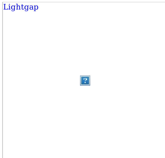
• Lightgap Deckeneinbauleuchten