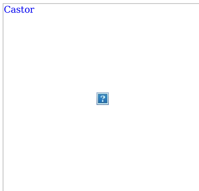
• Castor Pollerleuchten