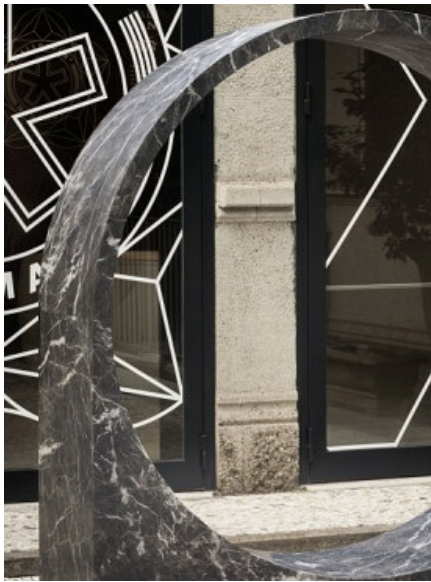
Compasso bench, Gustavo Martini and Testi