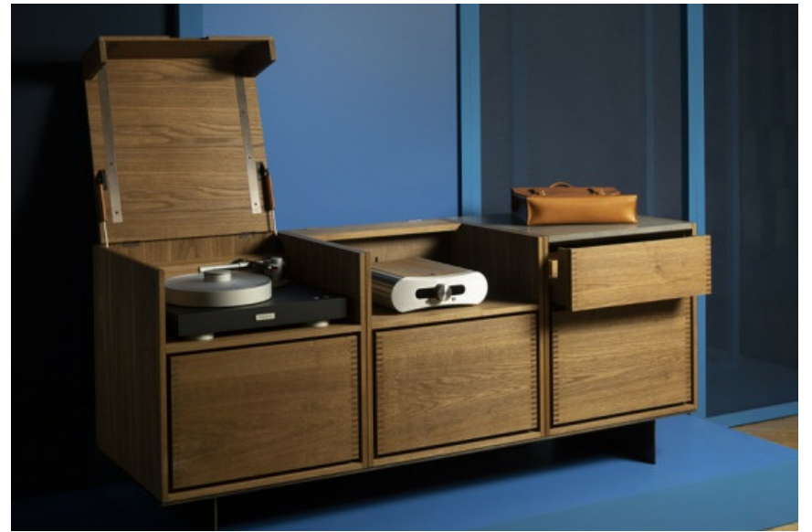
Cabinet of Love - OEO Studio, Garde Hvalsøe, Bergmann Audio, Gato Audio and Dahlman 1807