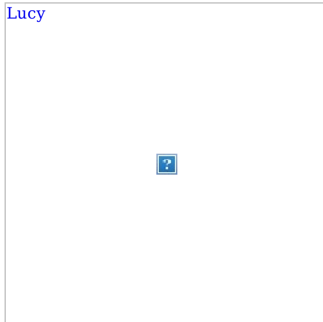
• Lucy Lampes de bureau