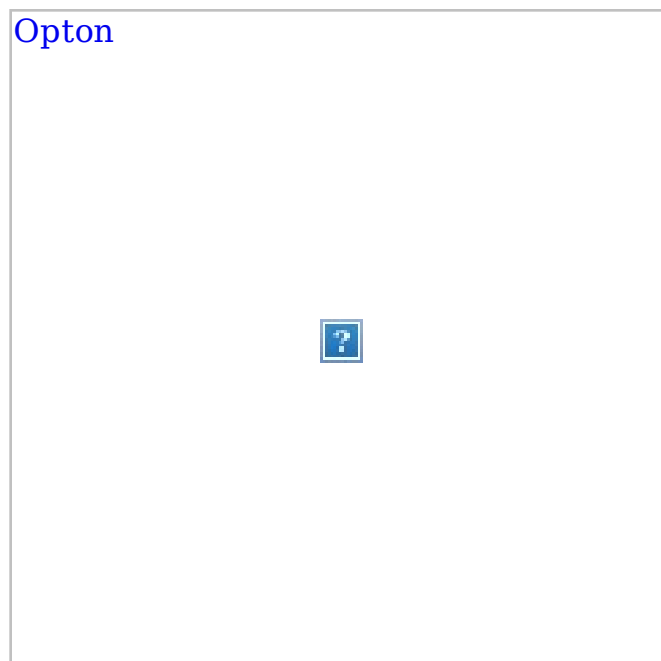
• Opton Appareils d'éclairage pour rails lumière